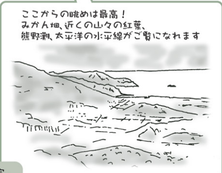
ここからの眺めは最高！みかん畑、近くの山々の紅葉、熊野灘、太平洋の水平線がご覧になります。